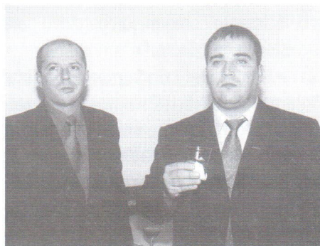
Representantes de 22 distribuidoras compareceram ao almoço-reunião promovido pelo SINAPEL.