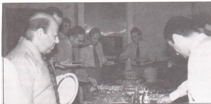
... grande número de associados.

No dia 11 de abril passado, os associados do SINAPEL participaram de um almoço-reunião, realizado no Dinho's Place, em São Paulo, ocasião em que, além de confraternizarem-se, discutiram alguns aspectos específicos do mercado.