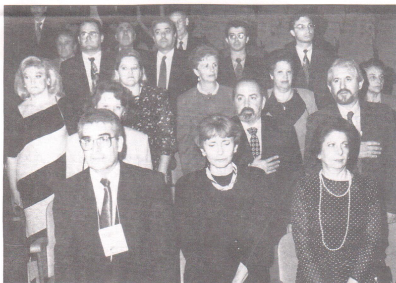
Momento da execução do Hino Nacional Brasileiro.