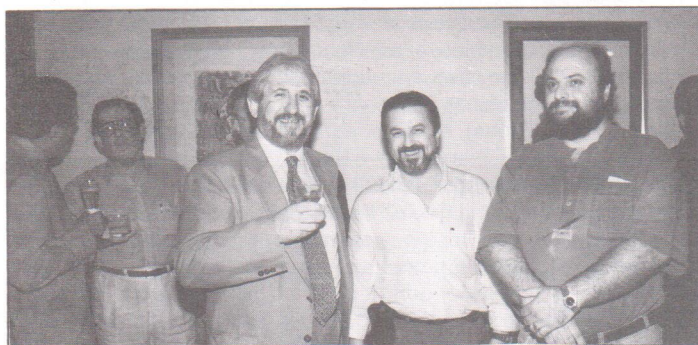
Almoço-reunião tem a participação de...